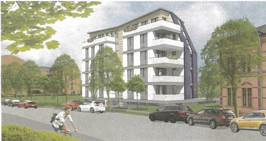
Wie in dieser Entwurfszeichnung soll der erste Teil des Solardomizils zwischen dem Seniorenstift Hechlerstraße/Ecke Salzstraße und dem Schloßkontor in Schlosschemnitz einmal aussehen.

Solardomizil ist aktuelles Großprojekt der Fasa AG – Start für zweiten Abschnitt noch in diesem Jahr